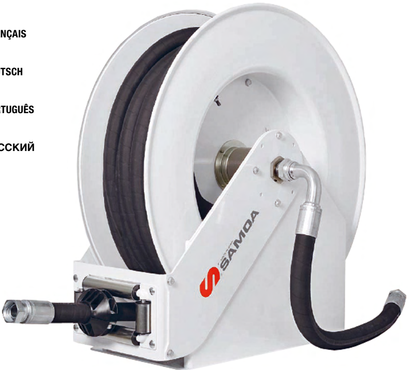
HIGH VOLUME HOSE REELS - 508 SERIES RM100