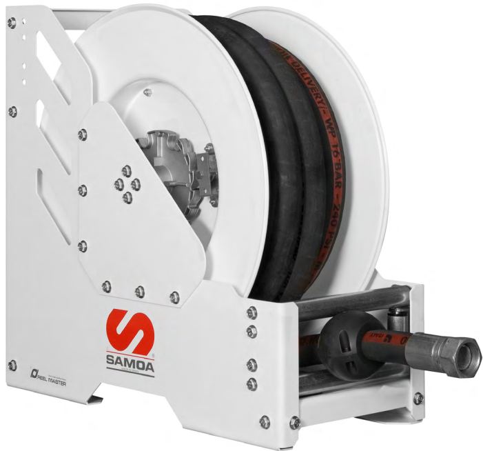
HIGH VOLUME HOSE REELS - 5088 SERIES RM150